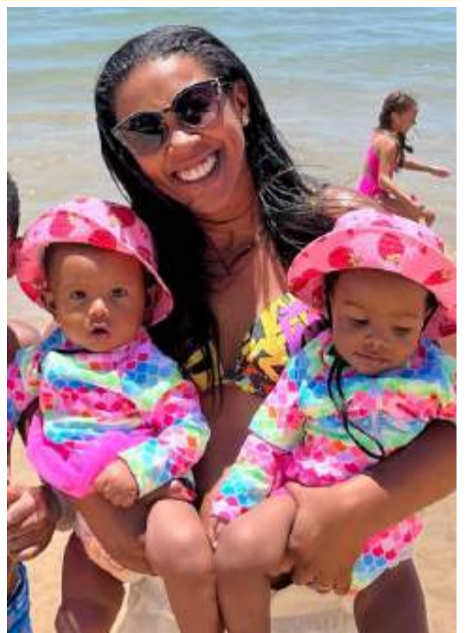
Um ano de duas vezes mais amor, dois sorrisos encantadores e infinitas alegrias. Parabéns pelo primeiro aninho das gêmeas, que vieram para duplicar a felicidade e encher o mundo de luz!