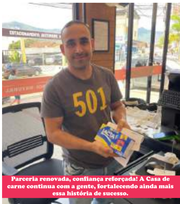
Parceria renovada, confiança reforçada! A Casa de carne continua com a gente, fortalecendo ainda mais essa história de sucesso.