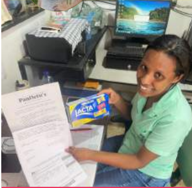
A GS segue acreditando na força da informação e renova sua parceria com o nosso jornal. Gratidão pela confiança e por caminhar conosco!

Aniversários, viagens, casamentos, horóscopo... por aqui você fica sabendo de tudo que acontece em nossa Região!