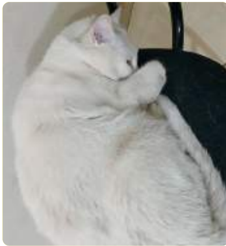
Messi fechou o semblante, olhou pra ela e lhe deu uma patada tipo direita potente do Mike