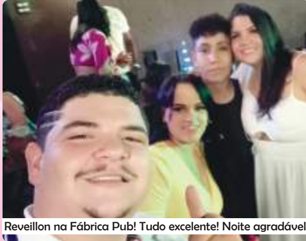
Reveillon na Fábrica Pub! Tudo excelente! Noite agradável!